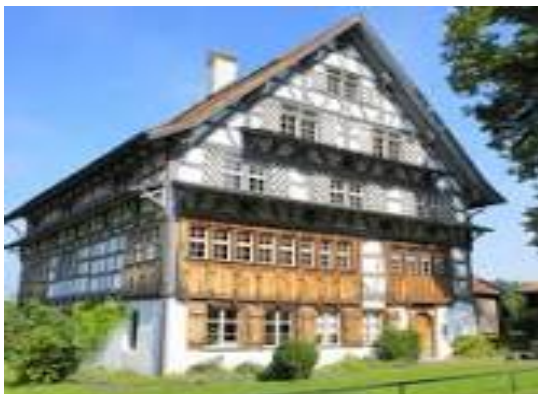
Altes Rathaus in Schwänberg